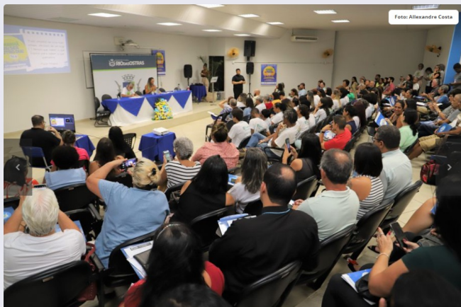
14ª Conferência contou com a participação de autoridades municipais, profissionais da área de Saúde e populares