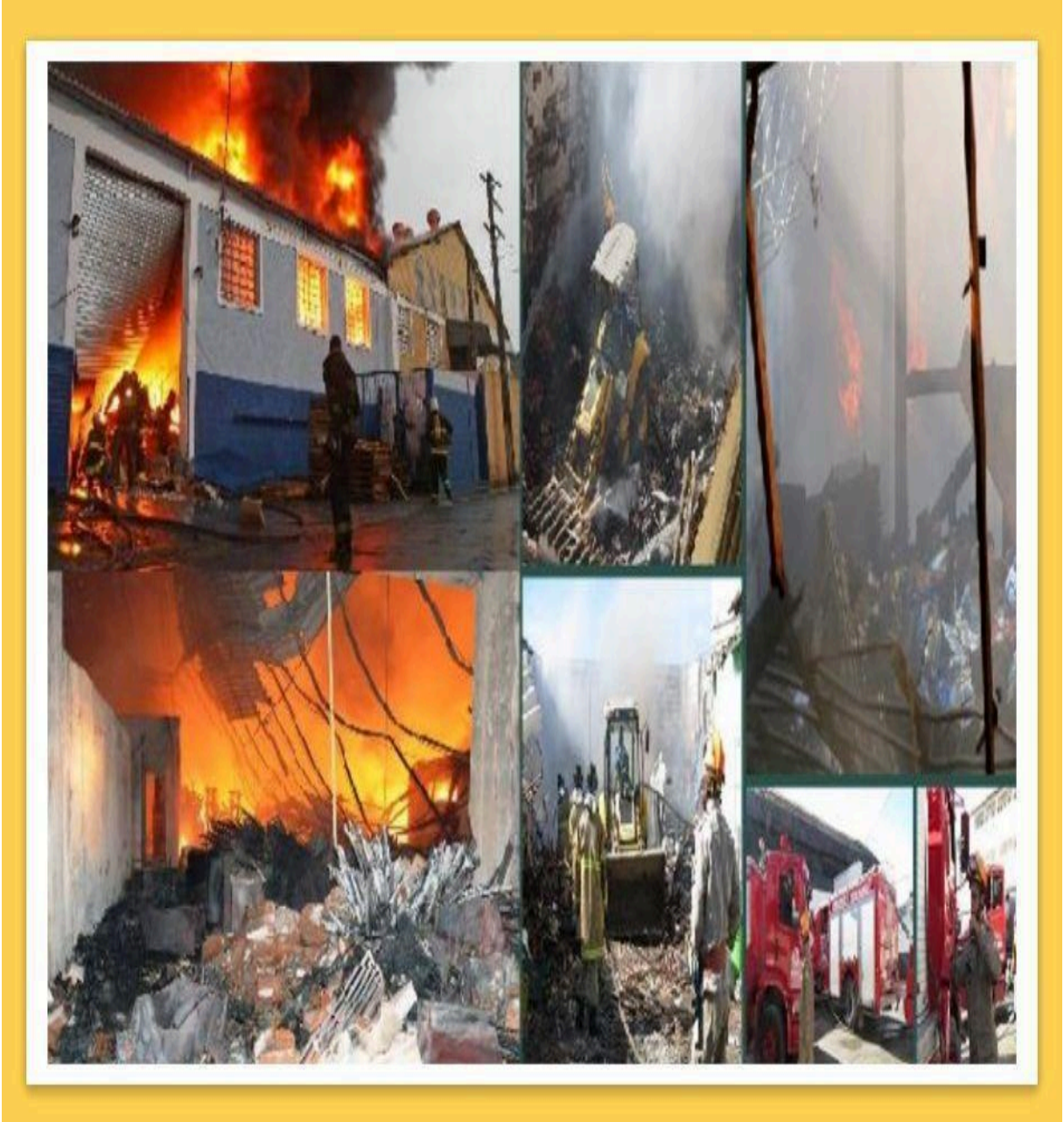
Imagens Ilustrativas/Fotos arquivos da Defesa Civil