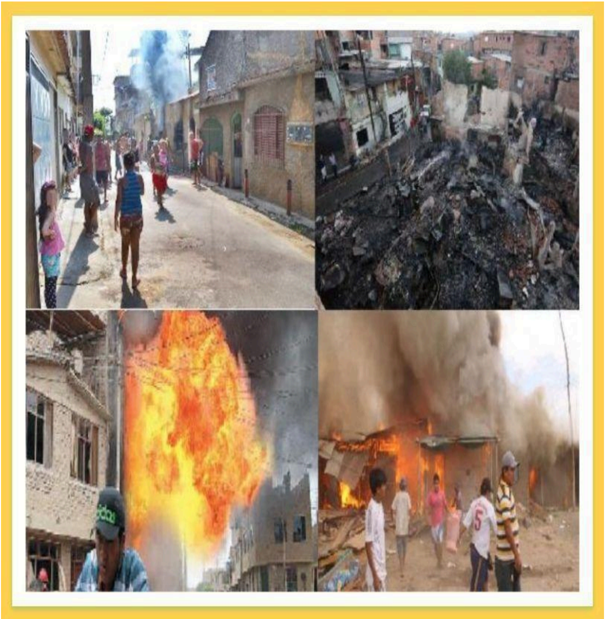
Imagens Ilustrativas