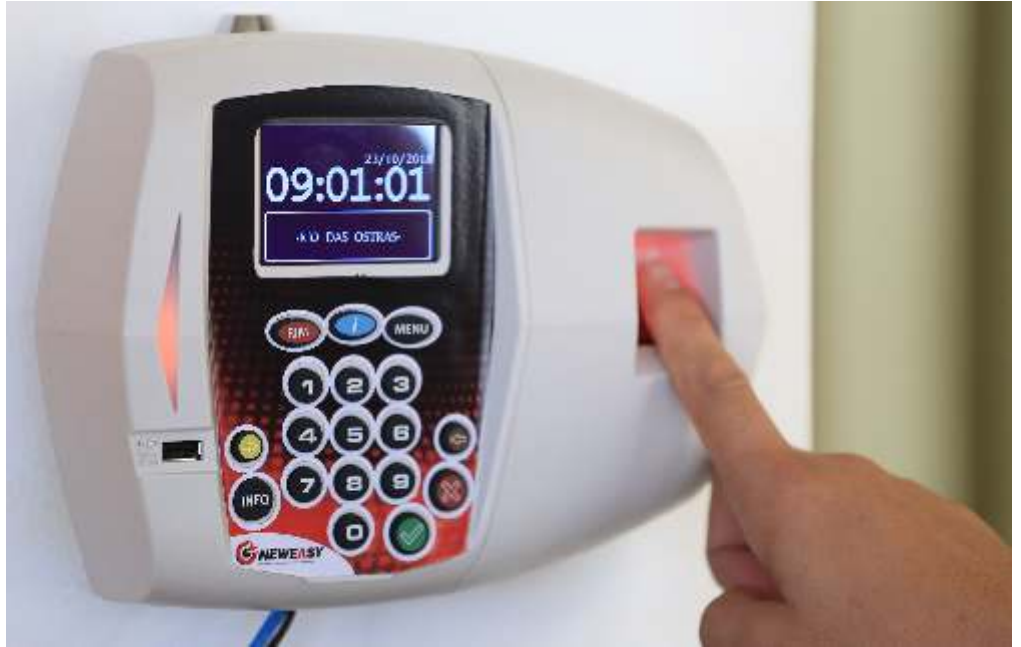
A fase de teste permite que o servidor se adapte ao novo sistema